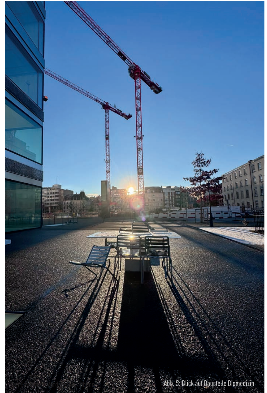
Abb. 5: Blick auf Baustelle Biomedizin

Weitere Informationen: www.vorderes-stjohann.ch