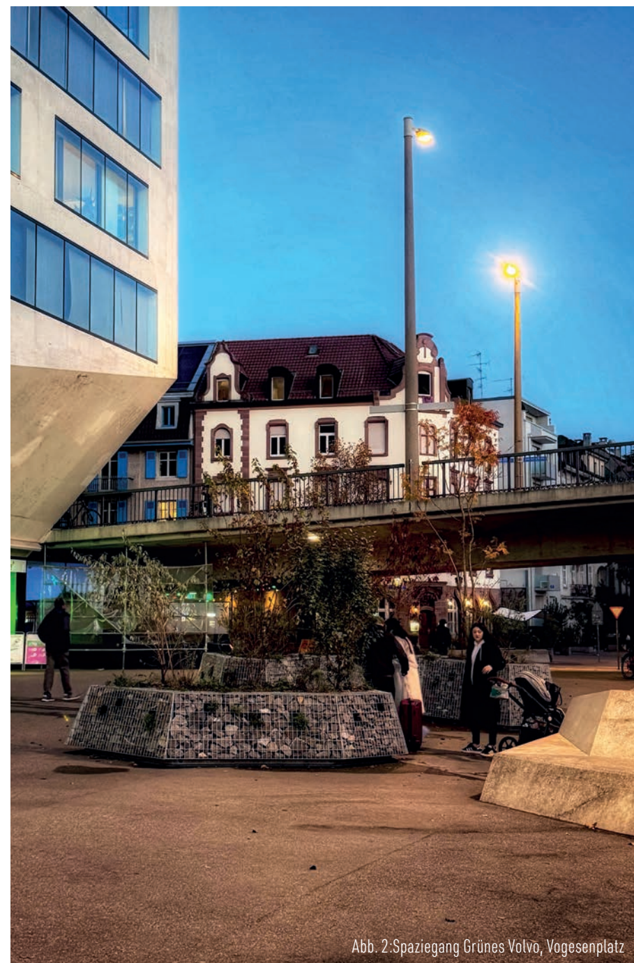
Abb. 2: Spaziegang Grünes Volvo, Vogesenplatz