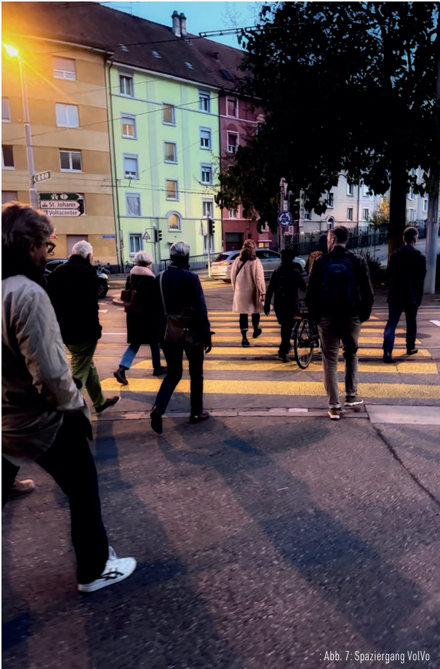
: Abb. 7: Spaziergang VolVo