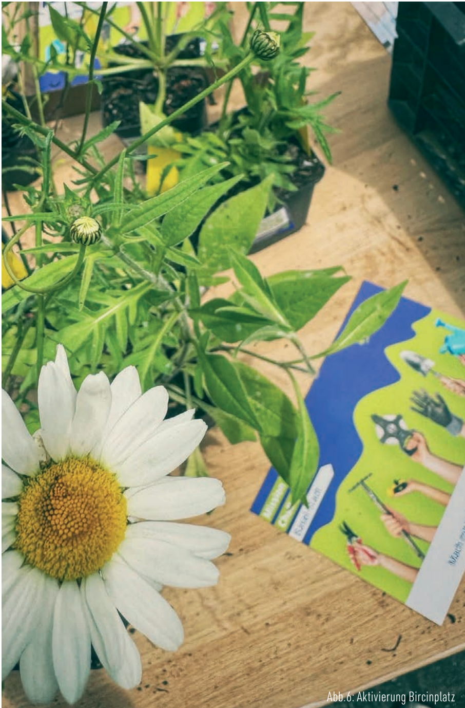
Abb. 6: Aktivierung Bircinplatz