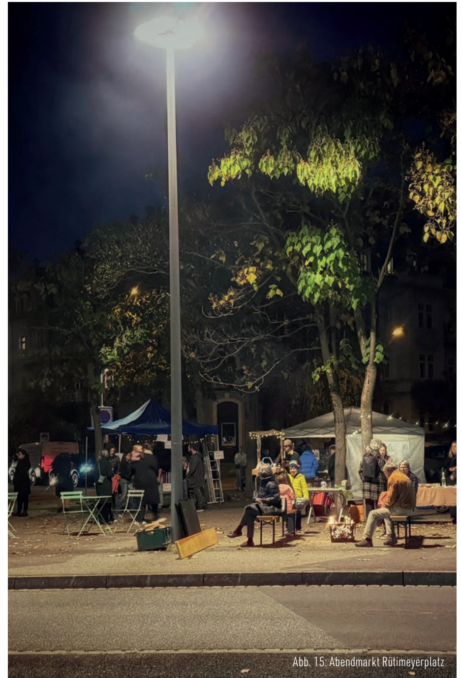
Abb. 15: Abendmarkt Rütimyerplatz

Einige Haltestellen in Basel-West haben jedoch eine besondere Bedeutung – sie bilden zentrale Drehpunkte im Quartier. Aus einem erweiterten Raumverständnis heraus, das öffentliche Räume, Wegbeziehungen, Nutzungen und Grünverbindungen mitdenkt, ergibt sich Potential für eine integrative Neugestaltung dieser Orte.