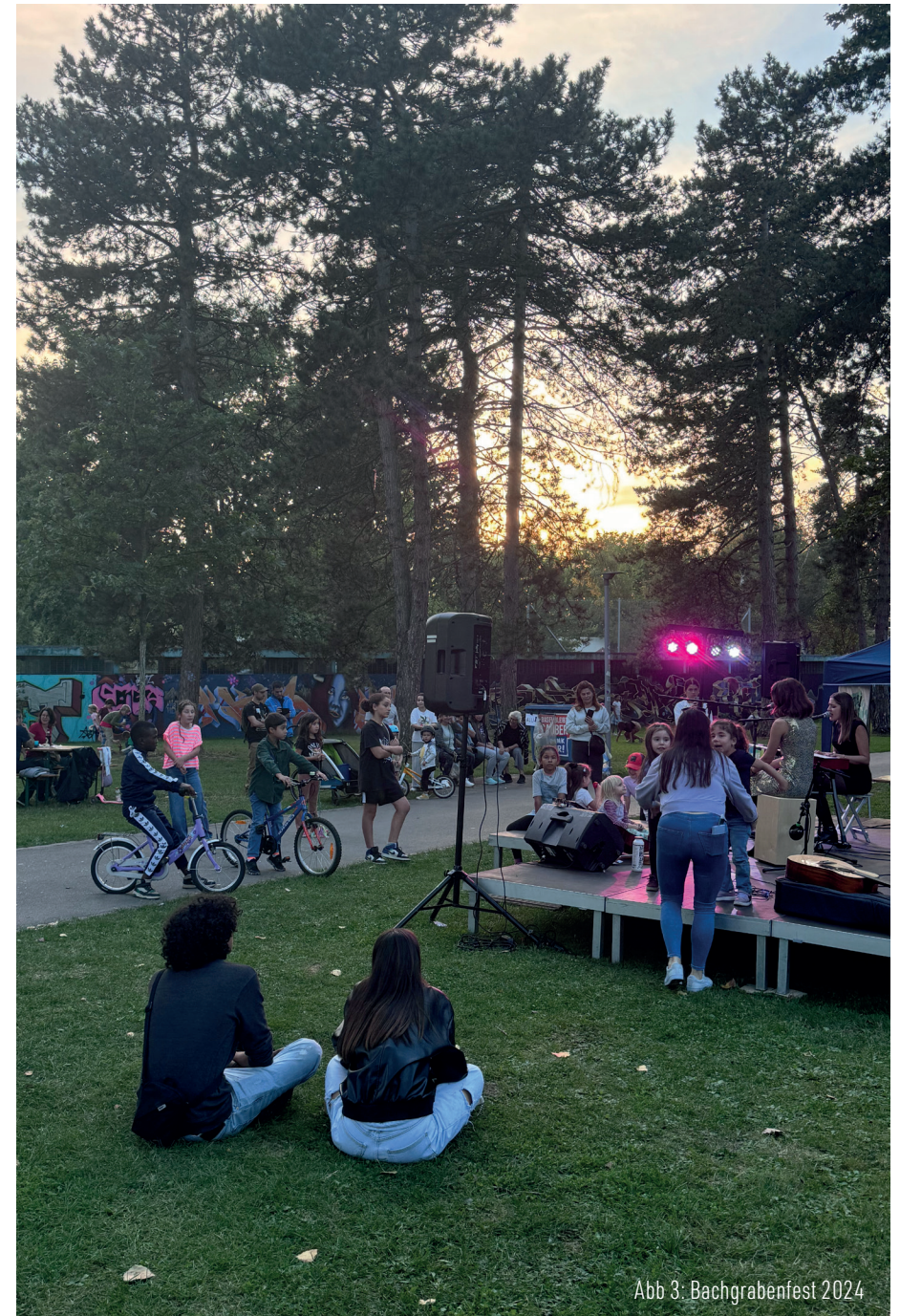
Abb 3: Bachgrabenfest 2024

Der Fokus liegt auch auf gemeinschaftsfördernden Projekten wie Gemeinschaftsgärten sowie auf die Begrünung des öffentlichen Raums, etwa entlang der Michelbacherstrasse vor dem Coop.