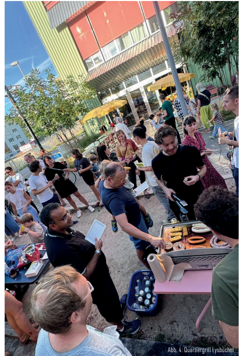
Abb. 4: Quartiergrill Lysbüchel